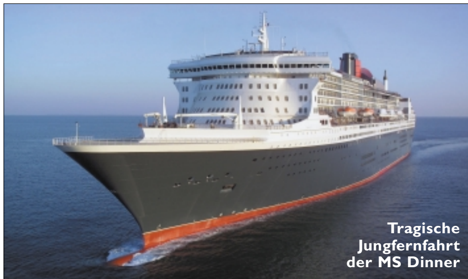
Tragische Jungfernfahrt der MS Dinner