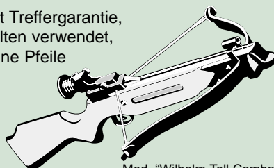
Mod. "Wilhelm Tell Combat"

Mit Treffergarantie, selten verwendet, ohne Pfeile